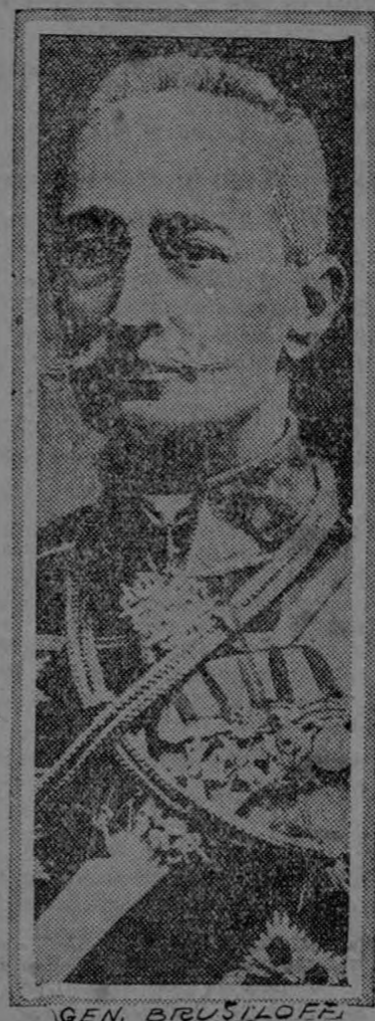
GEN. BRUSILOFF cuyo ejército salió vencedor en la batalla de Lutsk.

La impresión final que me quedó de mis visitas al frente británico, a los campamentos y a las fábricas, confirma el reclamo del superior y asombroso esfuerzo hecho por la Gran Bretaña, y de haber creado en dos años un ejército y haber fabricado municiones de gran tamaño, en tan grande escala, que iguala a los ejércitos del continente cuya organización ha costado cuarenta años de trabajo.